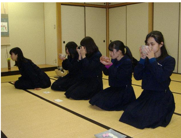
作法通りにお茶をいただきます。