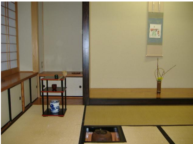
南風館和室の炬、棚、お花、掛け軸