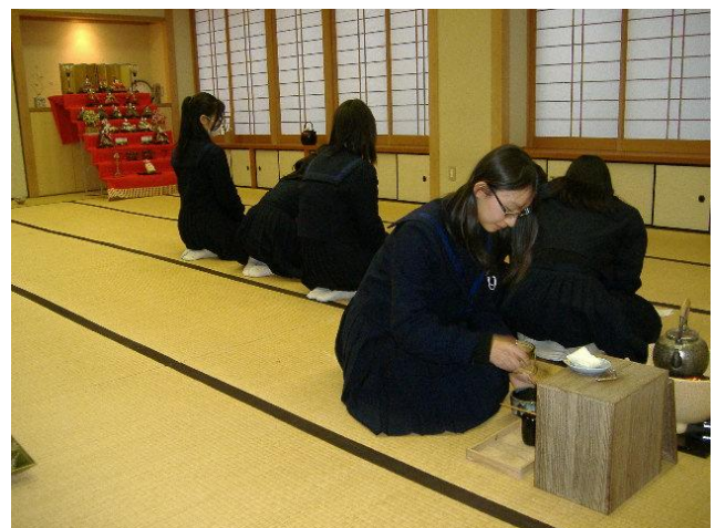
1年生は茶箱のお点前を披露します。