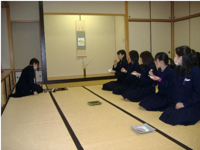
徳島県の淡柚（あわゆう）というお菓子と雛あられをいただきます。